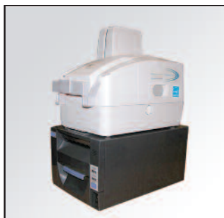
Optimisation de l'espace