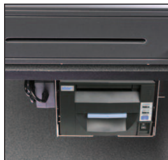
Para espaço em balcão limitado