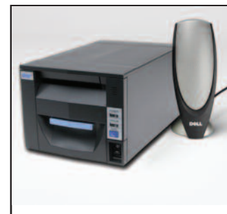
Ferramenta para comunicação com usuários