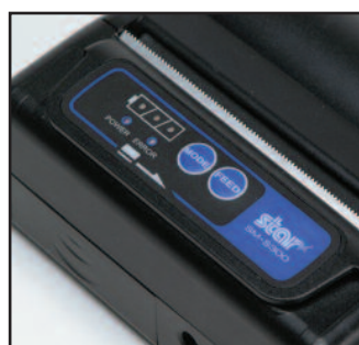
Bande de lecture magnétique