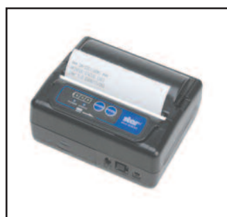
Reçus de 7,6 cm