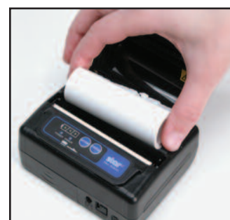
Chargement du papier facile